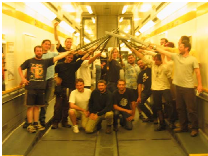
Le combat le plus profond au monde, dans le tunnel sous la manche

- Il fut très difficile de récupérer les lyonnais/parisiens et de définir un point de chute. J'ai du gérer les transports de ceux-ci en passant par Paris et nous avons failli manquer de chauffeurs. - Impossible pour moi de louer des minibus au 4 coins de la France sachant que j'étais le seul coordinateur sur l'action.