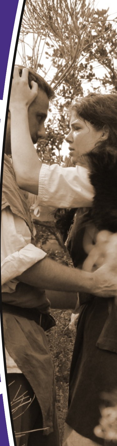
Truso ou Les Pierres du Silence