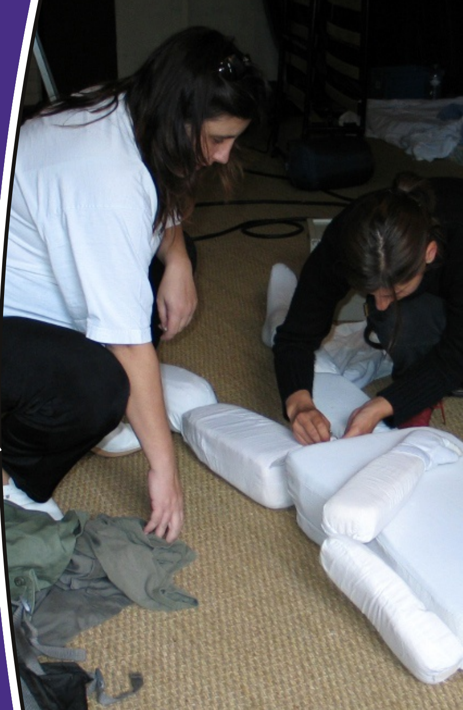
Organisatrices en train de coudre un faux cadavre, Mondes Parallèles 2004