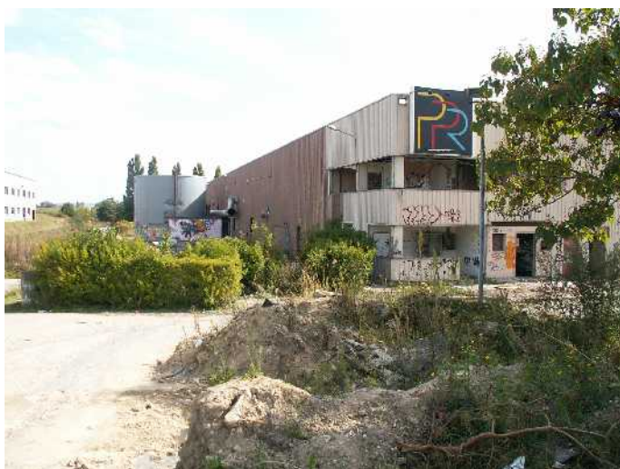
Entrée du site

Il s'agit d'un bâtiment industriel de 15000 m2 constitué de hangars et de bureaux.