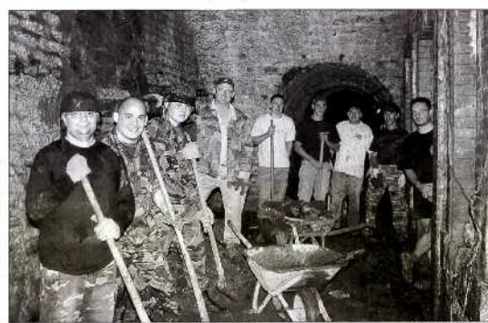
Les membres de l'association S-Airsoft débarrassent les galeries du fort d'Essert.

Les membres de S-Airsoft sont donc intéressés par toutes les propositions de travaux de conservation et de restauration de ce site.